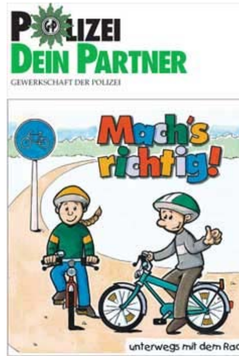
Unterwegs mit dem Rad

Im Straßenverkehr sind besonders die Kinder gefährdet. Richtiges Verhalten wird mit diesen Heften „spielend“ vermittelt.