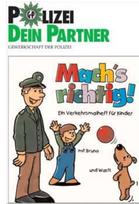
Ein Verkehrsmalheft für Kinder